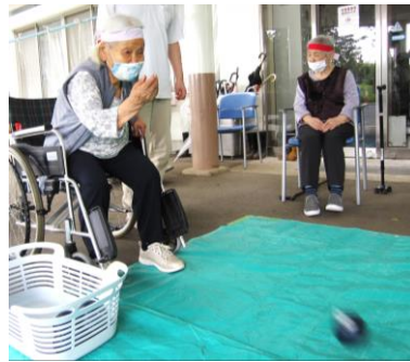
パラリンピックでおなじみ「ポッチャ」です！