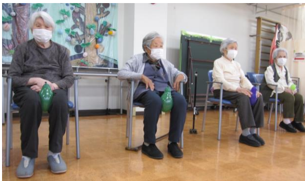
風船を膝に挟んで内転筋のトレーニング！！ 他にも全身を使って体操します。