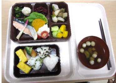
「運動会弁当」で元気を補給！！

5月25日(水)、『ミニ運動会』を開催！！今年も屋外開催。日頃の成果を発揮され、大いに盛り上がりました。